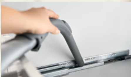
Sistemas de guías