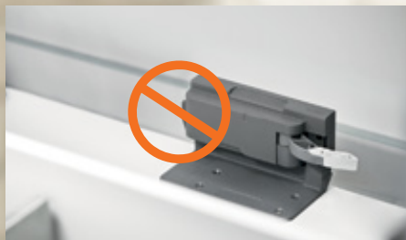
SERVO-DRIVE, el sistema eléctrico de movimiento asistido