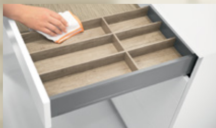
Bandeja-cubertero AMBIA-LINE, diseño en madera