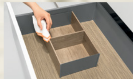
AMBIA-LINE para caceroleros, diseño en madera