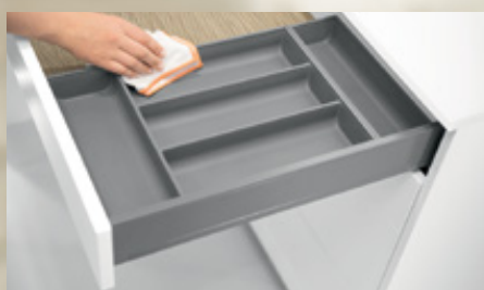
Bandeja-cubertero AMBIA-LINE, diseño en acero