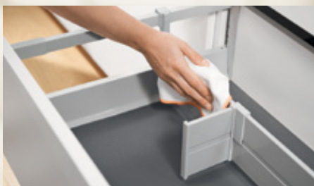
Divisor transversal ORGA-LINE