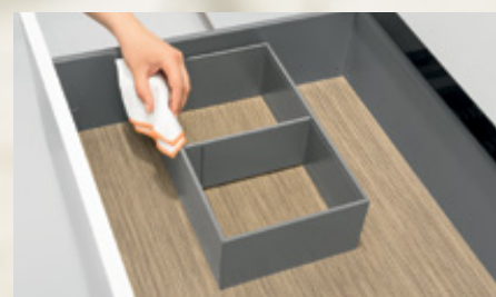
AMBIA-LINE para caceroleros, diseño en acero