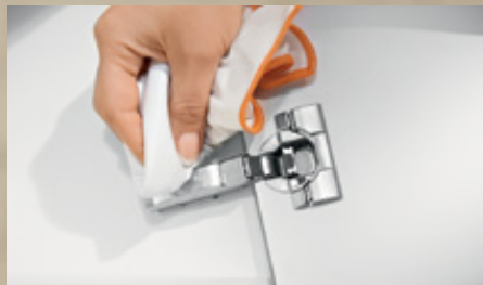
Sistemas de bisagras